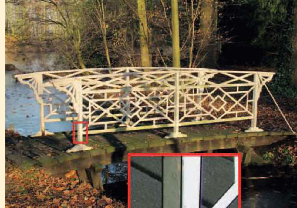
Hiernaast: De huidige ijzeren brug aan de noordwestzijde van het park, met detail van de huidige ijzeren brug. De detaillering is simpeler dan bij de oorspronkelijke, houten brug.